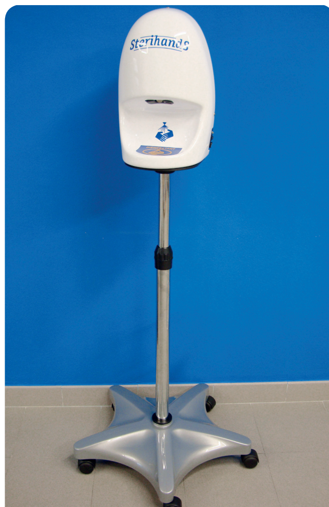
SUPPORTO MOBILE - MOBILE SUPPORT

The sanitising dispensing will last until you keep your hands inside the opening. The machine can be even set up in order to stop the dispensing after a prefixed time.